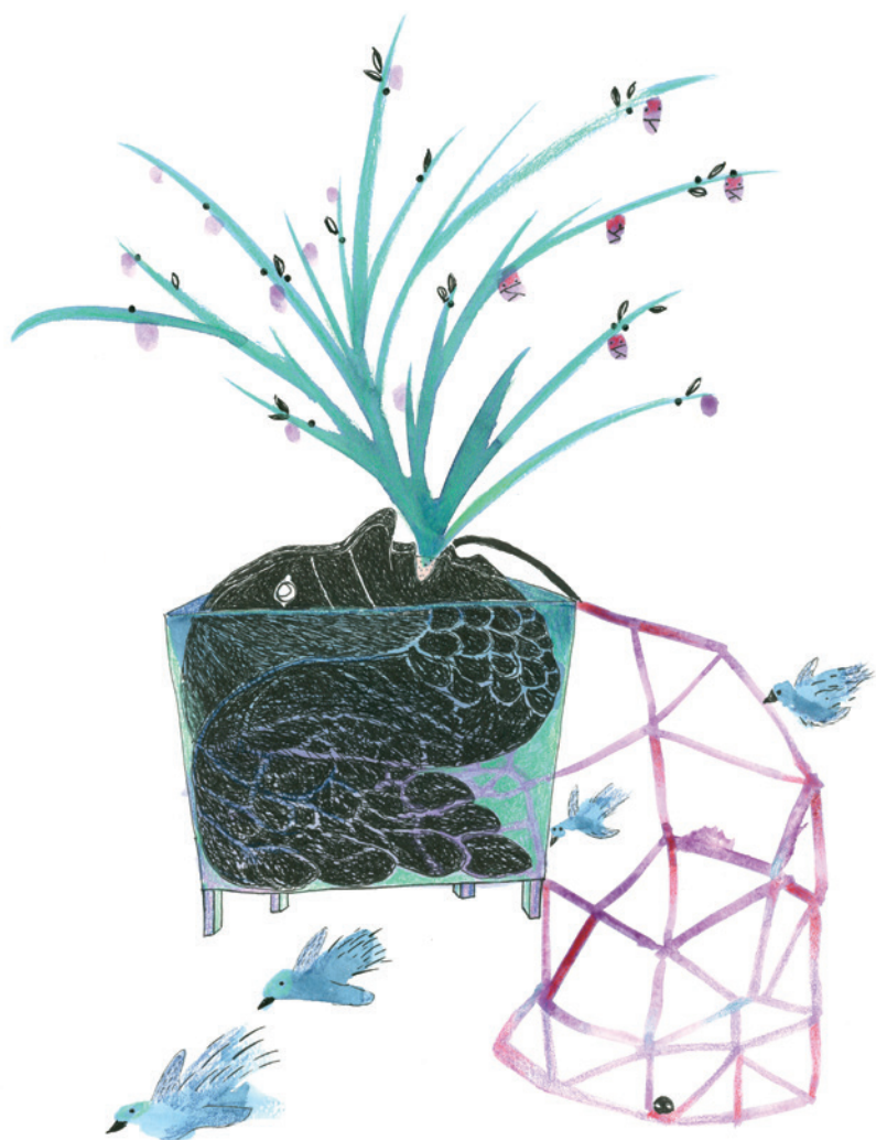
Z'otz* Collective, Building in Another's Curiosity , technique mixte sur papier / mixed media on paper 11" X 15" 2021