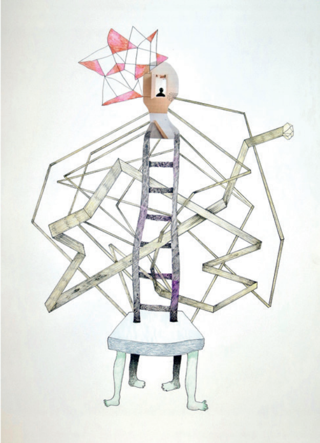
Z'otz* Collective, Messenger's Dynamic , technique mixte sur papier / mixed media on paper 22" X 30" 2020