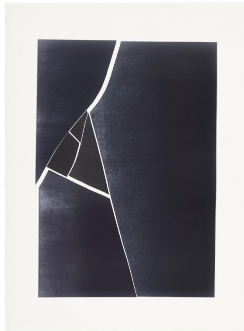
Pudenda 4-1 (2015).